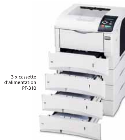
La machine présentée comprend des options.

Choisissez les options qui répondent à vos besoins: